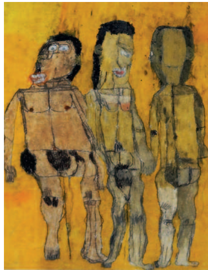
Helga Nagel, „Drei Menschen“

ARTelier Loackerhuus Hauptstrasse 21 6840 Götzis Tel.: 0 55 23 506-101 33